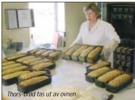
Thors-brød tas ut av ovnen.