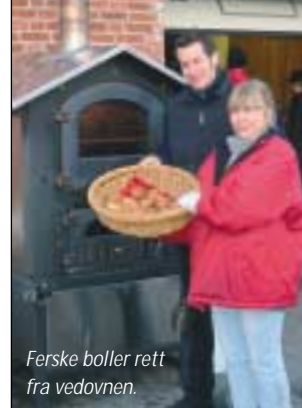
Ferske boller rett fra vedovnen.

rundstykker, boller og litt kjeks og kaker. "Månedens brød" var et forsøk på å gi kundene et alternativ til de daglige sortene. Det var spennende for både baker og kunder, selv om det ikke ble noen stor salgssuksess. Speltbrødet og 4-kornsbrødet ved navn Thors brød er de to brødene som selger best.