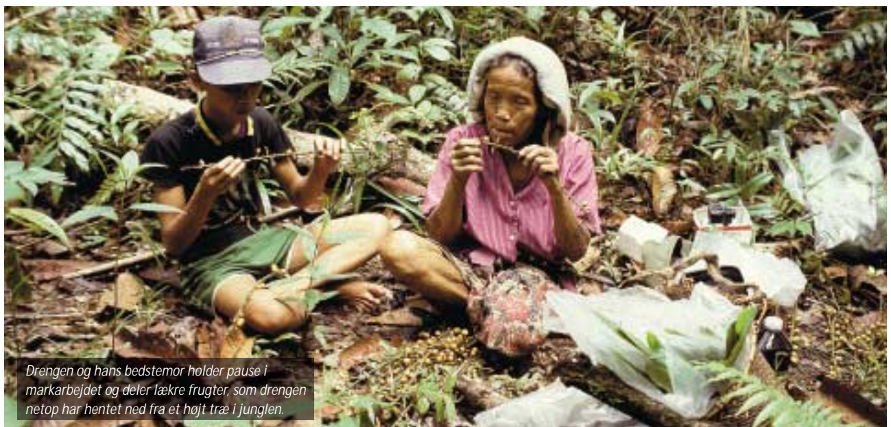
Drengen og hans bedstemor holder pause i markarbejdet og deler lækre frugter, som drengen netop har hentet ned fra et højt træ i junglen.

Man kan ikke have orden i sit åndelige liv medmindre man også tager vare på den verdslige