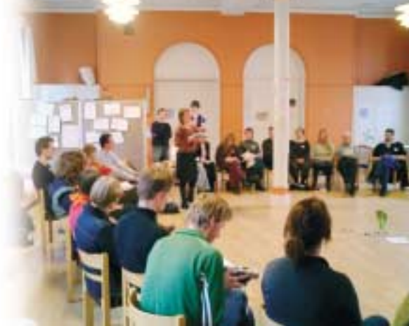
ca. 50 virksomheder og interesserede deltog i konferencen om den 4. sektor.

Offentlige udliciteringer, øget krav til hjælpeorganisationers egenfinansiering, øget fokus på den tredobbelte bundlinie er alt sammen processer i samfundet, der er med til give vækst til flere og flere virksomheder, der arbejder i feltet på tværs af, eller mellem, de traditionelle sektorer. Man fristes til at sige, at de tilhører en helt ny sek-