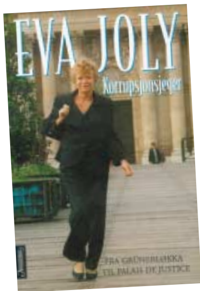
"Korrupsjonsjeger" af Eva Joly. Aschehoug 2001. Udførligt omtalt i Pengevirke 1, 2002

makt og penger enn ære og spennig, har for lengst oppdaget at det mest lukrative er å benytte kriminelle metoder innefor næringslivets pengestrømmer. Eva Joly har i sine bøker beskrevet hvordan svarte penger brukes til å vinne anbudskonkurranser. I en verden hvor konkurranse på mange måter er i ferd med å føre til en forverring av samfunnsforholdene, er det urovekkende å se at få politikere er opptatt av alternativer.