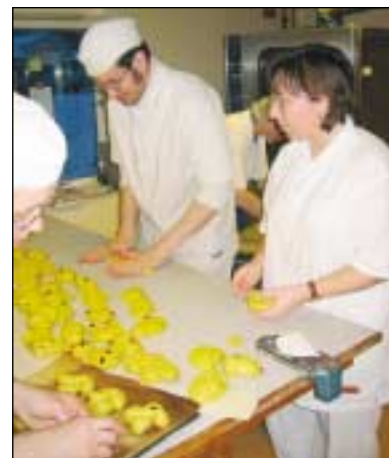
Her bakes Lussekatter til torgdag i byen.