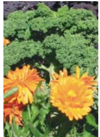
Ringblomst fra Sekem.