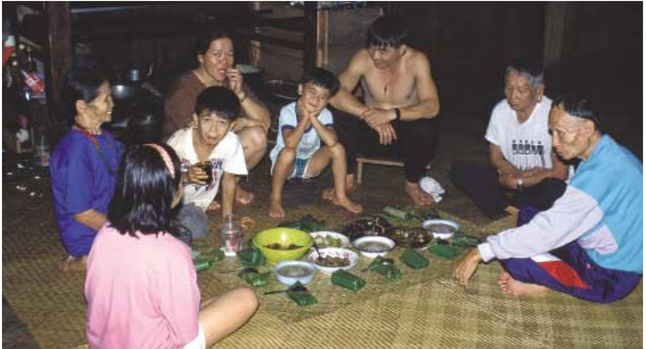
I langhuset hos Borneos indfødte befolkninger bor både onkler og bedsteforældre ofte med hos familien i kortere eller længere tid. Her er storfamilien samlet ved aftensmaden. Der er ris i de grønne bladpakker og tilbehøret består af vildsvin, vilde grønsager og svampesuppe.

arkalske relation stammer fra en tid, hvor den øverste bue i nøddeskallen ikke hed "relationernes bevidste ledelse". De to unge var i stand til at se et billede af hinanden på forhånd – også selvom de før ægteskabet aldrig havde truffet hinanden fysisk. Det var dette billede, de så rettede sig efter i ægteskabet. Da denne evne også i Østen er under hastig tilbagegang, kommer det individuelle op i de unge menneskers protest. Denne protest fører ofte til konflikter for alle relationer, også de europæiske, er på vej mod en opvågning til stadig nye faser og kvaliteter. Konflikter i relationer er lige pinefulde, hvad enten de optræder hos grupper af nydanskere, der står i opbruddet fra den patriarkalske relation eller hos herfødte danskere ved overgangen til den integrative relation.