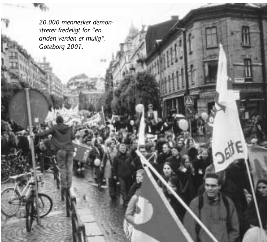
20.000 mennesker demonstrerer fredelig for "en annen verden er mulig". Gøteborg 2001.

Artikkelen finnes også på: www.merkurbank.dk/pengevirke www.cultura.no/pengevirke