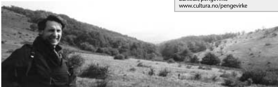
Martin Enghoff fra fonden Nordeco med bjergene fra Sjeravna i baggrunden.

Hotellet kan altså snildt huse 12 personer og det er hensigten, at de familier, der skal passe stedet, samtidig skal tilbyde vandreture i bjergene, fisketure ved en nærliggende flod, rideture, urteindsamling, plantefarvning, traditionel vævning og så videre. Alt under hensyntagen til områdets lokale befolkning, tradition og naturens