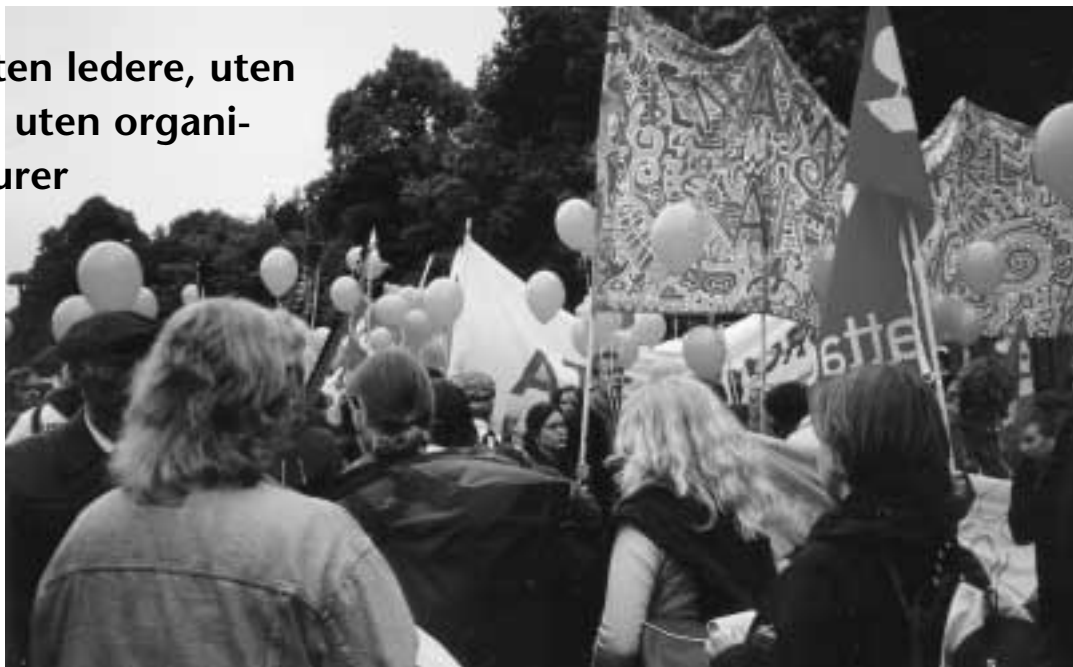
Göteborg 2001 - medens demonstrasjonen endnu var fredelig.