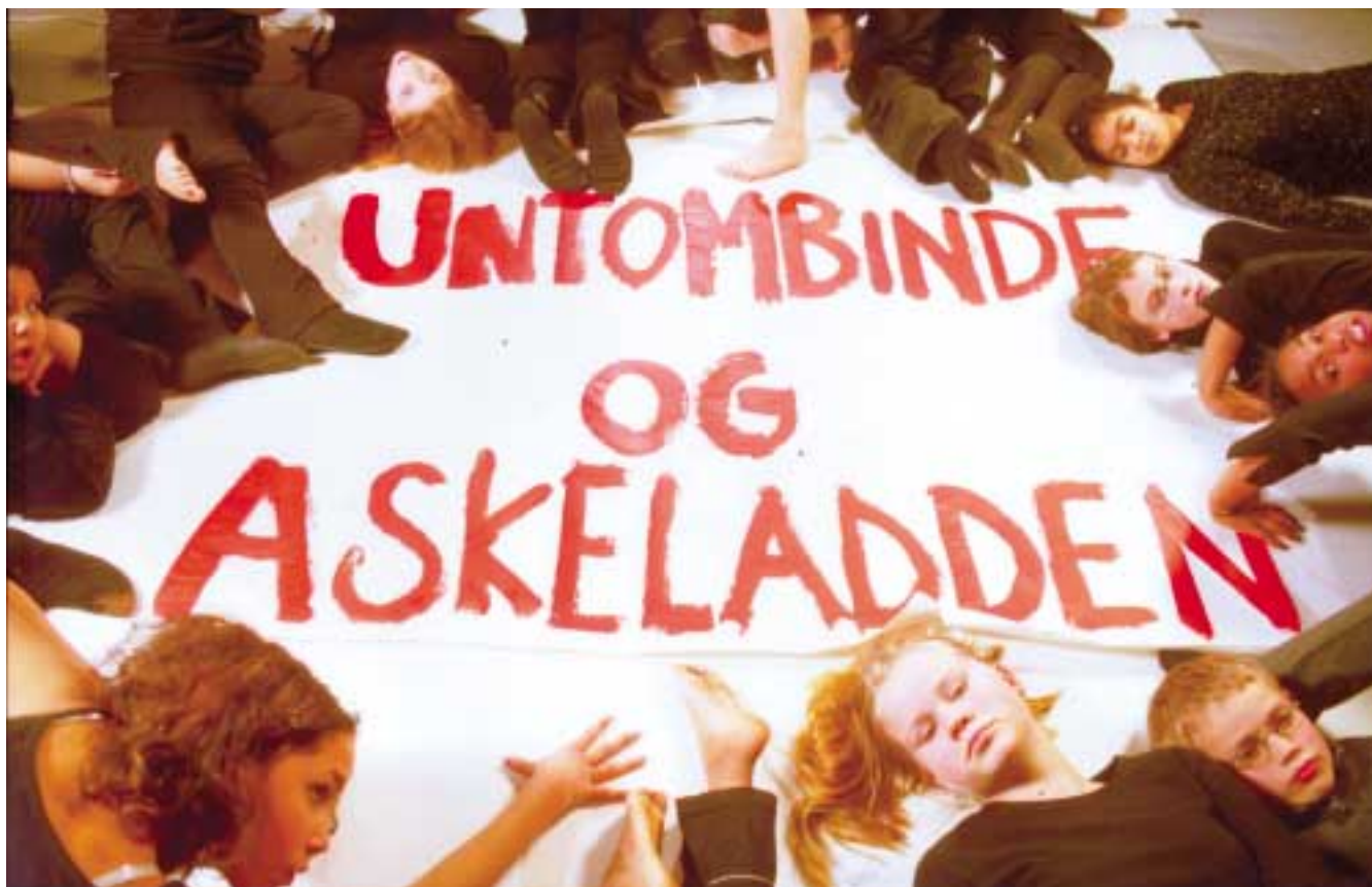
Fra barneteaterets forestilling "Untombinde og Askeladden".