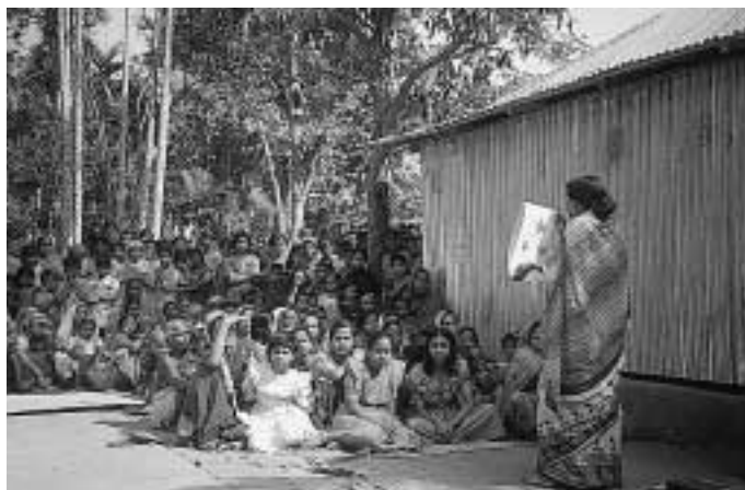
Landsbykvinner får undervisning om helse og ernæring.