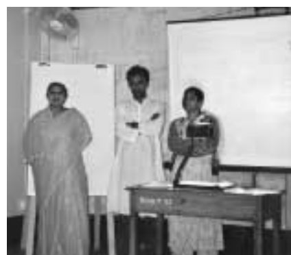
Noen av prosjektlederne i SUS orienterer om virksomheten.

SUS har gjort et omfattende arbeid blant annet i samarbeid med Norad, i det såkalte Kishoree Empowerment Project hvor de prøver å bevisstgjøre jentene på hvilke rettigheter de har og å gi dem mot til å ta ordet i familiesammenheng.