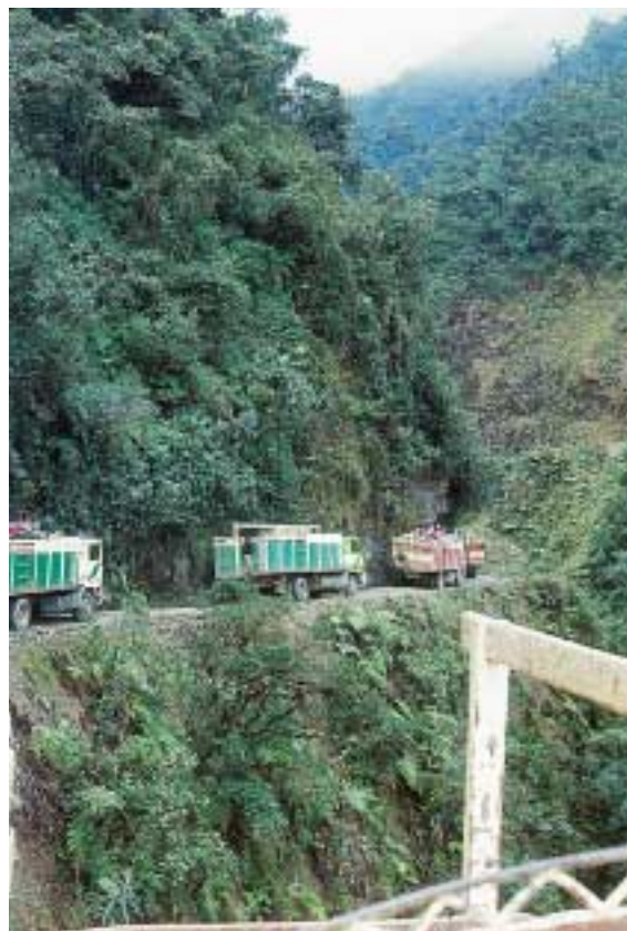
Kakaobønnerne transporteres i lastbil op til hovedstaden La Paz - turen gennem bjergene er storslået men også farlig.

Senere inså storkooperativet fordelene ved selv at forædle kakaoen fra den rå bønne (der eksempelvis går direkte til chokolade-produktion på europæiske fabrik-