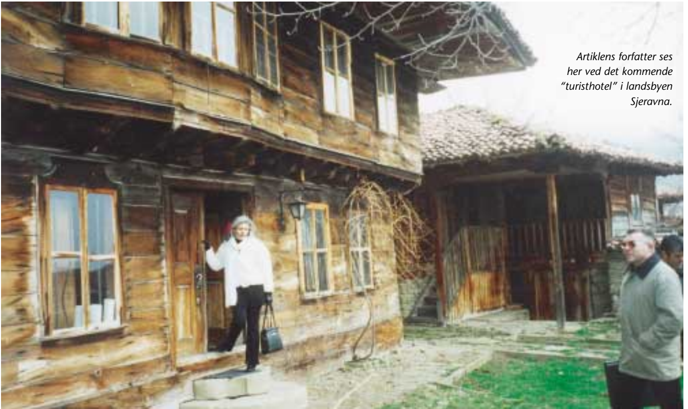
Artiklens forfatter ses her ved det kommende "turisthotel" i landsbyen Sjeravna.

Nordeco (Nordisk fond for miljø og udvikling) arbejder med rådgivningsopgaver omkring bevarelse af naturområder og har af sit overskud støttet flere mindre initiativer i den 3. verden. Merkur yder generel finansiering til Nordeco og har også ydet et lån til den danske støtte-gruppe for økoturist-projektet i Bulgarien.