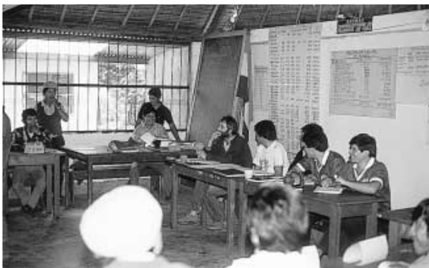
Medlensskab af El Ceibo-kooperativ betyder reel indflydelse på uddannelsesmuligheder og nok så vigtigt en fordelagtig afregningspris på den særlige økologiske cocoaønne.