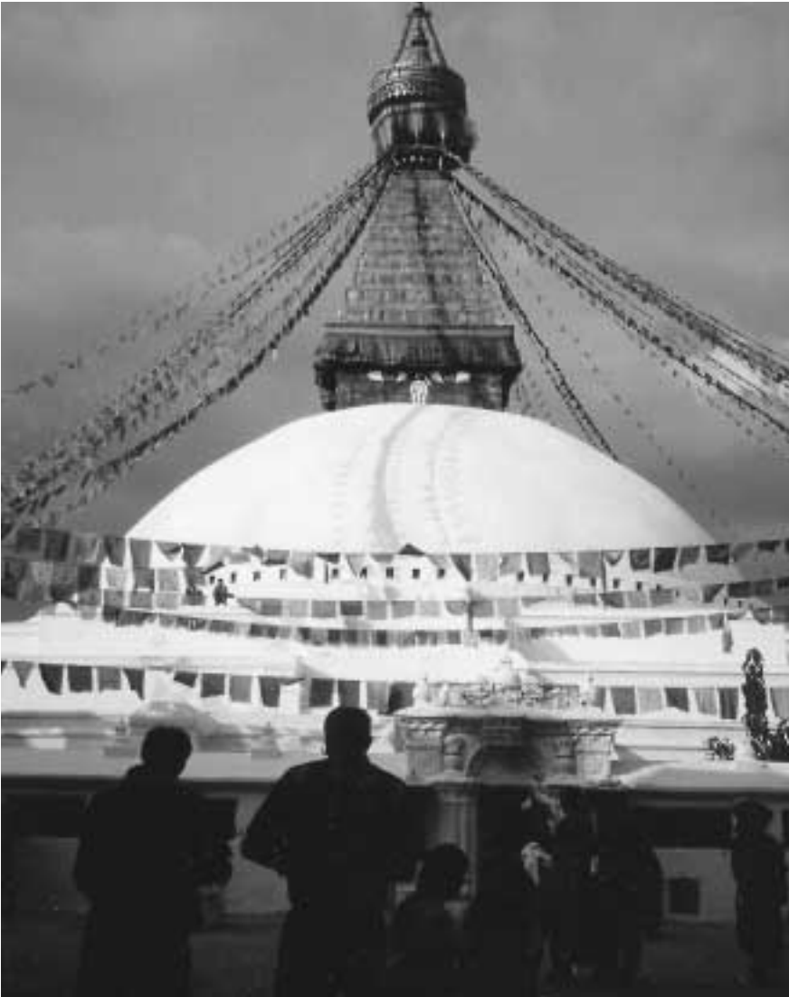
Billedet viser den 36 meter høje Boudhanath Stupa, en budhistisk helligdom, forsynet med Budhas altseende øjne og omkranset af tusinder af bedeflag...

de tibetanske flygtninge i Nepal og i Indien. Der satses overalt på små overskuelige projekter, som giver hurtig og effektiv resultat: Løn til en sygeplejerske, efteruddannelse af ældre mennesker, bygning af autoværksted, telefonforbindelse til skole, computere og lignende, sponsorstøtte til ældre, børn, munke og nonner. Alle donationer og sponsorbidrag går ubeskåret til de tibetanske flygtninge. Selv rejseudgifter til besigtigelse af projekter m.v. finansieres af rejsedeltagerne selv.