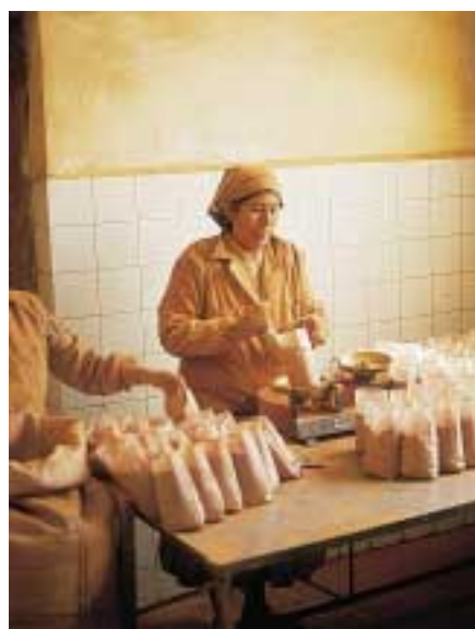
Kakaopulver pakkes i poser.