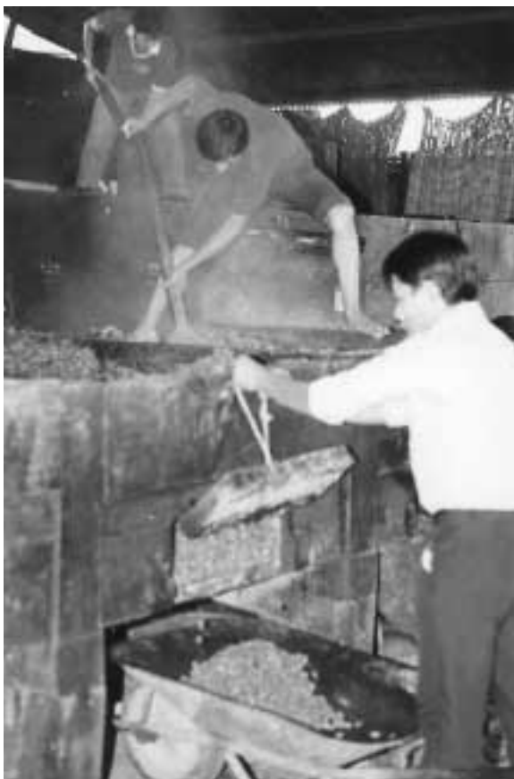
Gæring og tørring af cocoaønnerne foregår ofte ude hos bønderne.

ker) til et konsumprodukt, og en fabrik til fremstilling af kakaopulver blev opført i udkanten af La Paz, hvor El Ceibo siden også har etableret sit eget marked til distribution af frugt og andre tropiske afgrøder.