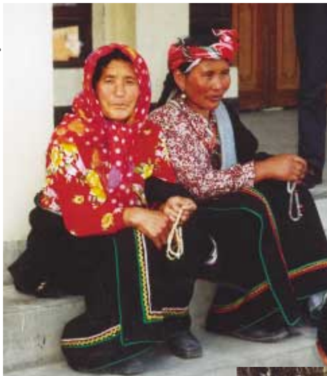
Personligt blev det som en åbenbaring af møde disse smukke og venlige mennesker.