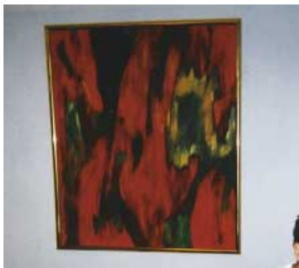
Fra Merkurs kontor i København.