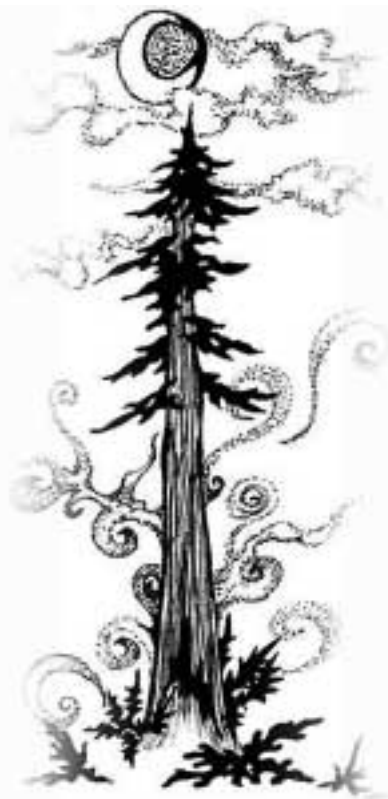
Fra bogen The Legacy of Luna . Tegnet af Julia Butterfly Hill.

Hun var chokeret og skræmt men forsøgte alligevel at kommunikere med dem. De lo blot af hende. Til sidst sagde hun: "Hvis der er bare lidt godt i Jer så gør mig en tjeneste. Bring mig noget økologisk mad." De lo stadig ad hende, men luskede dog af. Nogle dage senere kom den ene tilbage med en kurv med fødevarer.