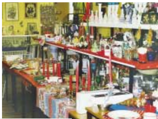
Genbrugsbutikken i Odense.