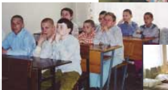
Fra et børnefængsel i Skt. Petersborg