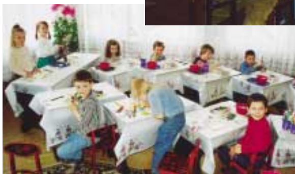
En lilleskole i Skt. Petersborg

Projekt Øst er organiseret som en landsdækkende forening med mere end 1000 medlemmer. Det økonomiske grundlag er medlemskontingenter, gaver fra private, institutioner, skoler, virksomheder, indsamlinger, fonde m.fl. Hertil kommer at al arbejde udføres af frivillige. Der er ingen udgifter til lønninger og omkostninger til administration holdes på et absolut minimum.